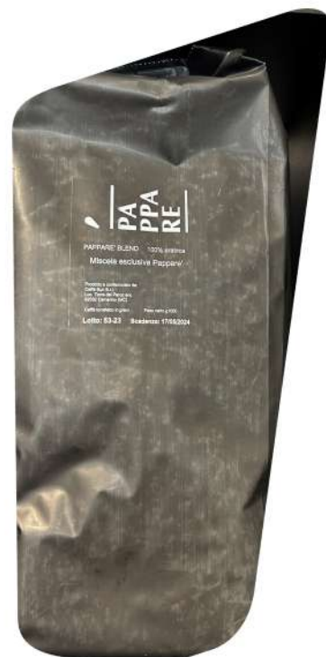
Confezione di PAPPARE' BLEND

SE SOFFRI DI ALLERGIE O INTOLLERANZE ALIMENTARI COMUNICALO IN ANTICIPO AL NOSTRO PERSONALE COSÌ DA POTERTI GUIDARE ALL'INTERNO DEL MENÙ